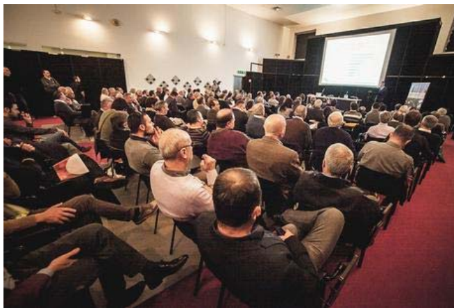
Convegno dell'edizione 2015.

Il convegno continuerà con un altro argomento di grande attualità, quello dei consumi e della promozione del prodotto , fondamentale per favorire conoscenza e diffusione della pera nel mondo. Con un intervento, sempre a cura del CSO Italy, verrà presentato "L'andamento dei consumi in Italia e le possibilità nei principali mercati di sbocco". Anche questa seconda giornata del Forum si concluderà con una tavola rotonda che coinvolgerà i principali rappresentanti della produzione e del commercio dei grandi Paesi produttori dell'emisfero nord del mondo e della Grande distribuzione organizzata italiana ed estera.