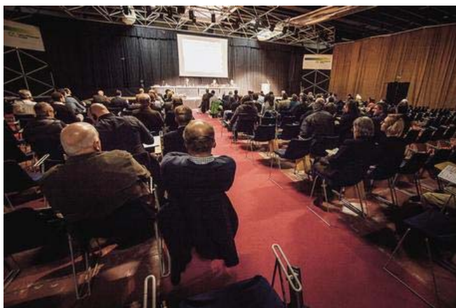
Convegno dell'edizione 2015.