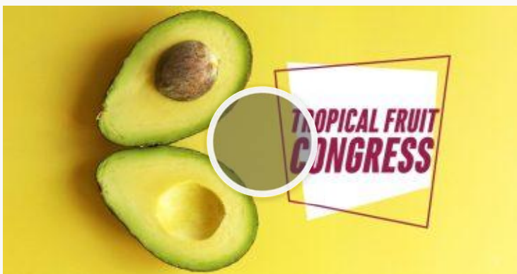
Avocado e mango protagonisti al primo Tropical Fruit Congress