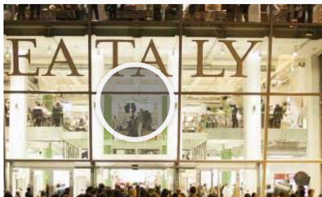
Eataly in Borsa? Guerra: "Lo faremo quando saremo pronti"