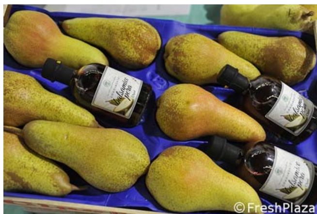
Balsamico-azijn van Abate peren

De naar schatting honderd exposanten presenteerden hun innovaties. Cesari uit Bologna introduceerde zijn Multiplex machine. Dit 'front tool' kan worden gebruikt bij snoeiwerkzaamheden en is zowel tijd- als brandstofbesparend.