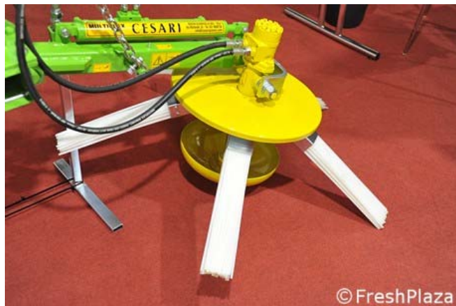
Multiplex roterende systemen

De naar schatting honderd exposanten presenteerden hun innovaties. Cesari uit Bologna introduceerde zijn Multiplex machine. Dit 'front tool' kan worden gebruikt bij snoeiwerkzaamheden en is zowel tijd- als brandstofbesparend.