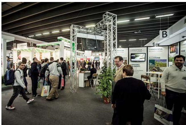
La edición de 2015

La feria dedicada a las peras se celebrará en Ferrara (Italia) del 16 al 18 de noviembre. Se trata de la segunda edición después de la de 2015, que tuvo mucho éxito. Los expositores han crecido en número y ahora son 120, y también los compradores extranjeros son más numerosos. "FuturPera 2017 será la ocasión perfecta para hacer contactos y forjar relaciones a nivel internacional gracias a la presencia de compradores de países importadores en potencia. Vienen para conocer mejor los productos y las empresas exportadoras", señalan los organizadores.