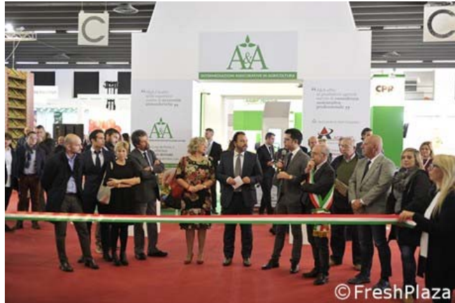
Un momento dell'inaugurazione

Il format iper-specializzato è piaciuto e ieri tanti operatori interessati al mondo della pera hanno partecipato alla rassegna FuturPera, a Ferrara. L'area espositiva è divisa in tre settori, nettamente distinti fra loro: commercializzazione, mezzi tecnici e meccanizzazione.