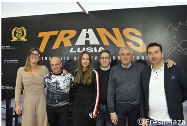
La squadra di Translusia

Alcune prove hanno dimostrato che i tempi di raccolta vengono ridotti del 15% grazie all'accessorio e anche il lavoro ottiene risultati migliori, con meno errori di calibrazione.