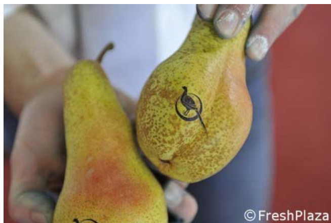
La stampa con inchiostro alimentare totalmente edibile

"L'inchiostro è di tipo alimentare - aggiunge il collega Stefano Buccio - così da poter essere mangiato anche nel caso in cui il frutto non venga sbucciato. Entro poche settimane presenteremo un inchiostro di origine totalmente naturale che potrà essere certificato anche sul biologico".